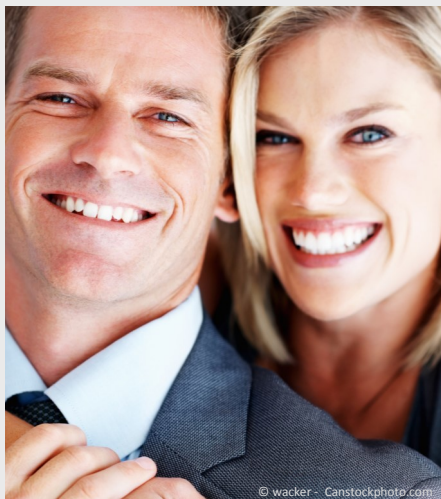
Selbstsicher mit gepflegten Zähnen

Dann werden Mund, Zähne und Zahnfleisch untersucht. Die Zahnbeläge werden angefärbt, um sie besser sichtbar zu machen und es wird die Tiefe der Zahnfleischtaschen gemessen.