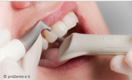
Zahnreinigung mit Pulverstrahlgerät

Auch wer seine Zähne regelmäßig und sorgfältig putzt, erreicht nicht alle Zahnoberflächen. Das sind vor allem die Stellen unter dem Zahnfleisch, in manchen Zahnzwischenräumen und die sehr feinen Grübchen auf den Kauflächen.