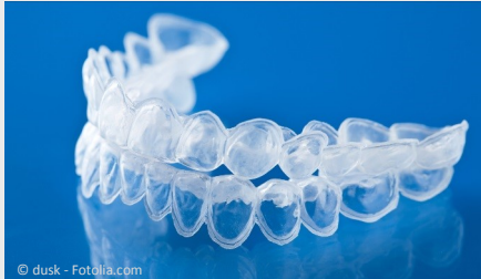
Bleaching-Form aus Kunststoff, in die Sie das Aufhellungs-Gel einfüllen.

Beim Home-Bleaching werden vom Zahnarzt dünne flexible Formen aus einem transparenten Kunststoff hergestellt, die genau auf Ihre Zähne passen (siehe Foto).