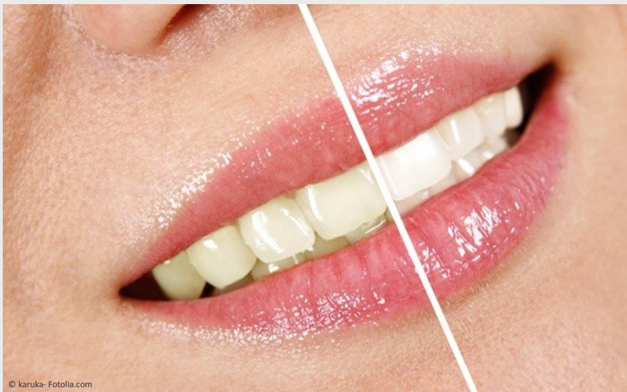
Deutlicher Unterschied: Professionelles Bleaching beim Zahnarzt wirkt!

Vertrauen Sie Ihre Zähne besser Profis an!