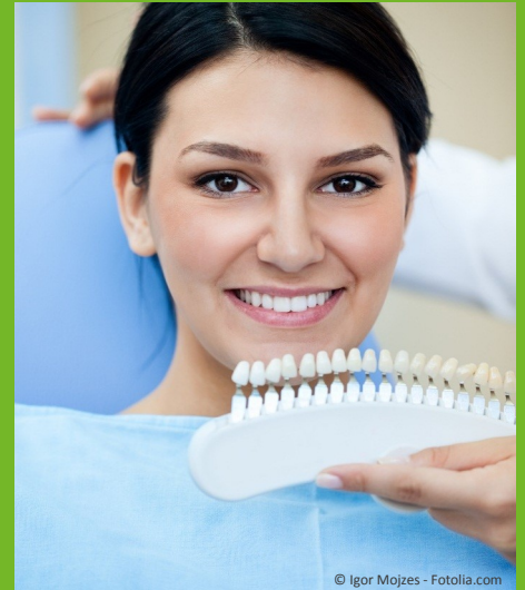
Bleaching vom Zahnarzt: Gewinnendes Lächeln mit strahlend weißen Zähnen

Dunkle Zähne können ein ziemliches Ärgernis sein: Obwohl sie sauber geputzt sind, wirken sie einfach nicht hell. Die Folge ist: Man traut sich oft nicht mehr, unbefangen zu reden und zu lächeln. Man achtet darauf, dass andere die Zähne nicht sehen. Und wenn man fotografiert wird, lässt man den Mund lieber zu. Das muss nicht sein: Zähne können heute mit bewährten Methoden wieder aufgehellt werden. Professionelles Bleaching beim Zahnarzt kostet nur wenige Hundert Euro. Aber das neue Lebensgefühl ist unbezahlbar!