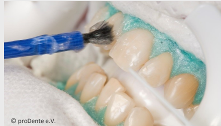
Power-Bleaching beim Zahnarzt: Auftragen des Bleaching-Gels

Wenn Sie die Praxis wieder verlassen, können Sie sich an sichtbar helleren Zähnen freuen!